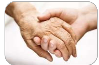
Социальная поддержка граждан