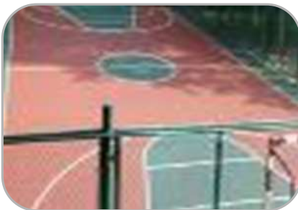
на физическую культуру и спорт