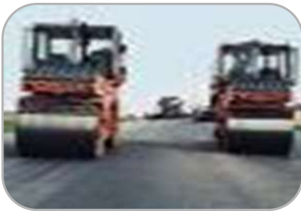
на национальную экономику