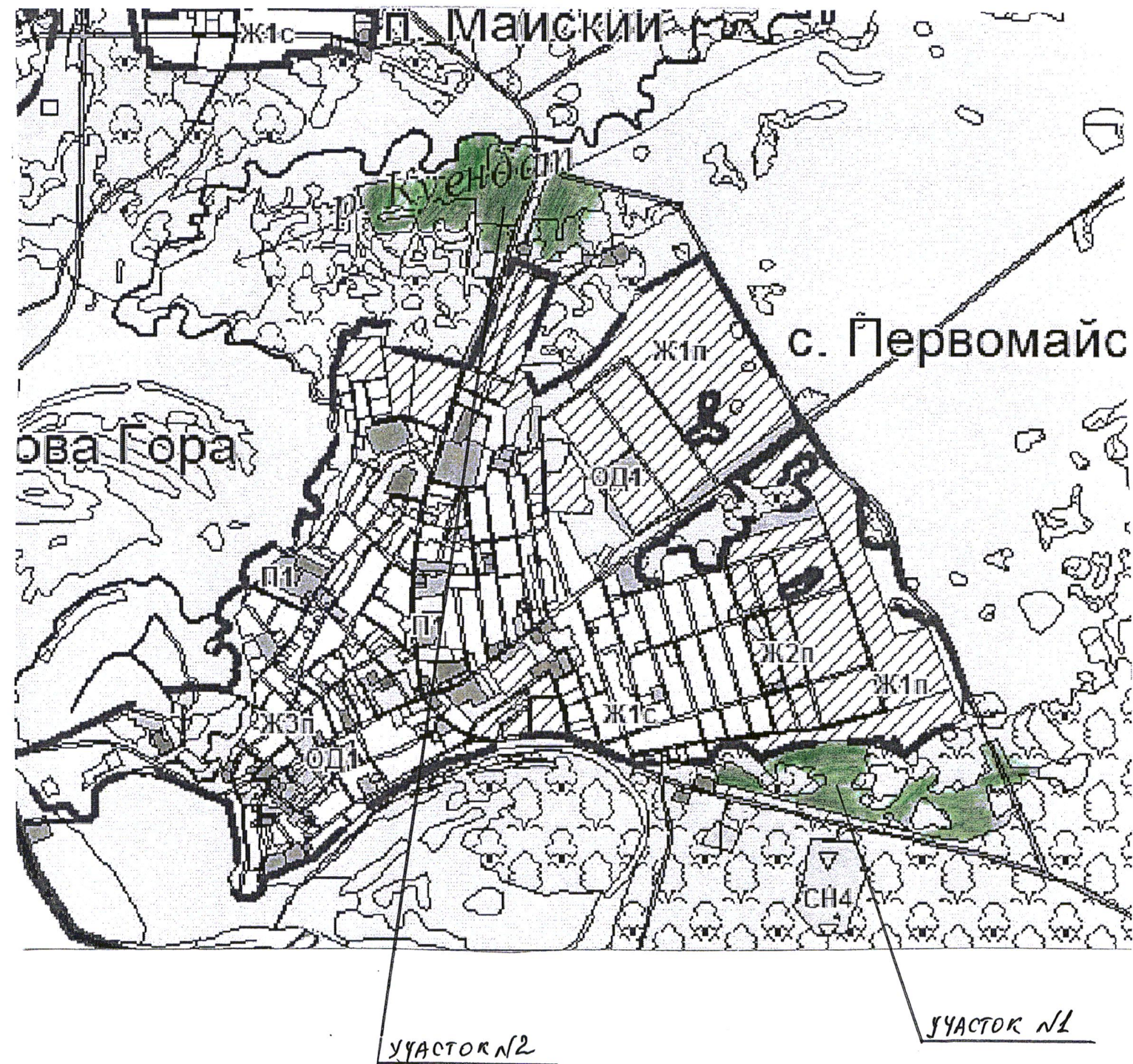
Схема расположения земельных участков определенных для выпаса сельскохозяйственных животных и домашней птицы н.п. Первомайское (участок №1, №2)